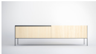
Hoski, Ash Series

La sede espositiva è un ex capannone industriale di 2000 mq, dove Promotedesign.it crea un percorso esperienziale scovando e selezionando accuratamente brand innovativi, young label e marchi storici per mostrare il meglio che il panorama del design contemporaneo ha da offrire. Nelle edizioni precedenti Din – Design In ha ospitato oltre 800 realtà provenienti da più di 80 nazioni differenti che hanno mostrato la propria idea di design, raccontando l'iter progettuale che ha portato alla realizzazione dell'oggetto e messo in evidenza le caratteristiche distintive di ogni singolo Paese.