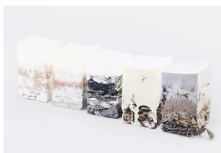
Nothing, Hayoung Lee, Strata Stool Series

Grande spazio è lasciato alle Accademie e alle Scuole di tutto il mondo che, con i loro progetti sperimentali, mostrano al visitatore un volto fresco e avanguardistico del design. Tra loro Masterstudio Design del FHNW Academy of Art and Design di Basilea, l'Università degli studi G. d'Annunzio di Chieti-Pescara, le studentesse del NID, Nuovo Istituto Design di Perugia.